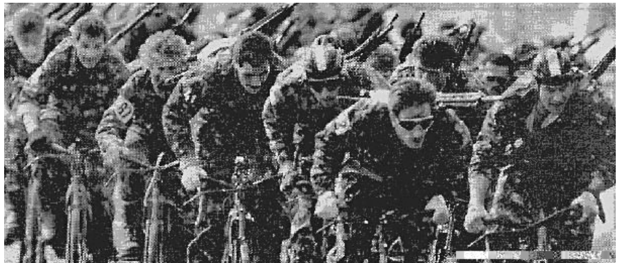
Letztes Militar-Radrennen von St. Gallen nach Zurich am 7.10.2001

Zudem gibt es ab 2003 keine Radfahrer-Rekrutenschulen mehr.